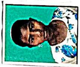
ಶಿಕ್ಷಕರು = ಶಿಕ್ಷಕರು