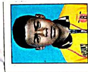
ಶಿಕ್ಷಕರು = ಶಿಕ್ಷಕರು