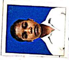
ಶಿಕ್ಷಕರು = ಶಿಕ್ಷಕರು