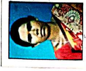
ಶಿಕ್ಷಕರು = ಶಿಕ್ಷಕರು